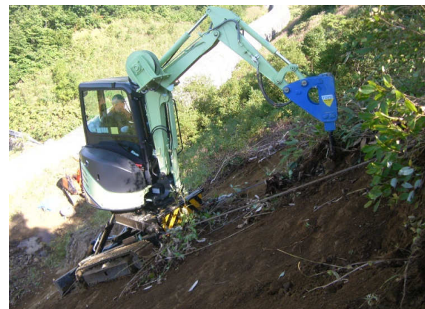
ブレイカーによる岩盤掘削