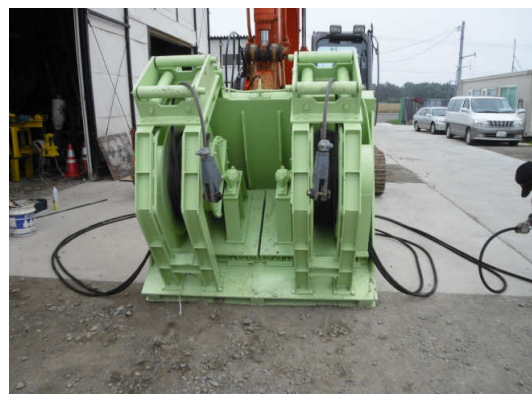
左上 親機ウインチ 左下 親機 右 子機